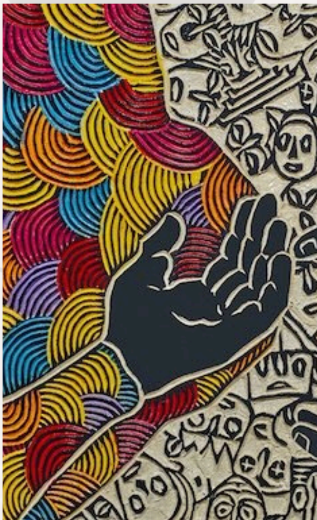
Zoom sur le tableau de l'artiste sud-africain Sthenjwa Luthuli lors de l'exposition Inkaba Yami.